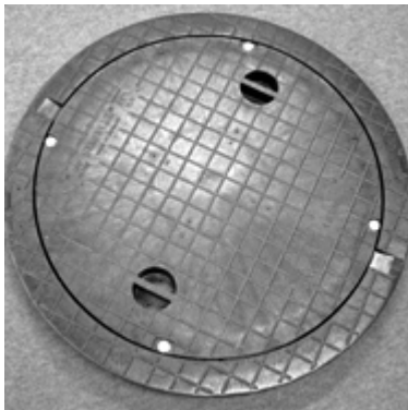
Foto 1 (Abbildung 15kN MG) STABIFLEX Swiss-Edition DN 600, TWD – Deckel je nach Modell nur 6,0 – 7,5 kg! CH-Modulrahmen und Deckel mit oder ohne Griffmulden tagwasserdicht u. geruchshemmend, 4-fach Verschraubung