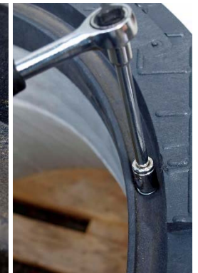
Foto 5 - 9 Befestigungsset M mit 2 expansionsfreien Lastankern. Mit Spezialbohrer ohne Schlaghammer Löcher für Lastanker bohren (s.h. Datenblätter). Bolzenanker auf entsprechende Setztiefe mit Hammer einschlagen, Muttern und Rahmen wieder entfernen. Zwecks Abdichtung Falz mit Brunnenschaum (z.B. Sika-Boom D) Ausschäumen. Rahmen auf die 2 Bolzenanker aufsetzen und mit U-Scheiben und Muttern anschrauben.