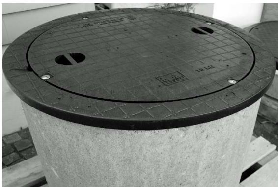
Foto 10 (Abbildung 15kN MG auf DN 600) Swiss-Edition Schachtabdeckung montiert auf Betonrohr resp. Brunnenring. Deckel muss zwecks Kindersicherung und Dichtigkeit 4-fach am Rahmen verschraubt werden.