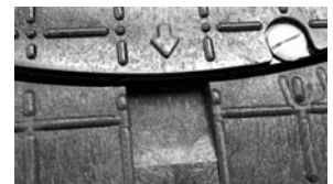
← Zwischenraum mit Noppen für Beschriftungsschild am Rahmen